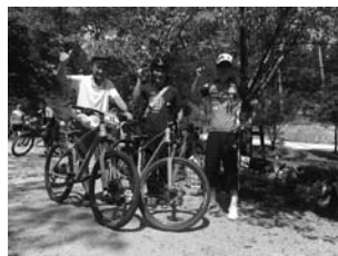
和束町ゆぶねMTBランド視察 (8/30)