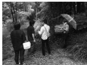
各務野自然遺産の森を視察 (6/10)