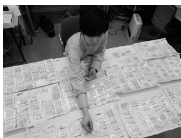
アンケート集計作業の様子（滋賀県立大学）

※アンケート結果の詳細は別紙「アンケート結果報告（概要版）」を参照ください。また、より詳しい「調査報告書」は、当法人のウェブサイトからダウンロードできますし、ご希望の方はお問合せいただければ郵送いたします。