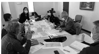
今後に向けたワークショップを実施 (2/4)